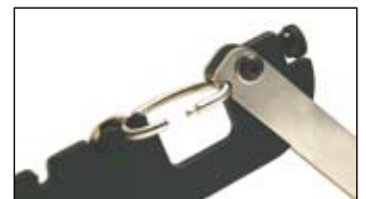
Werkzeuge zum Schließen und zur Versiegelung des Schlüsselrings.